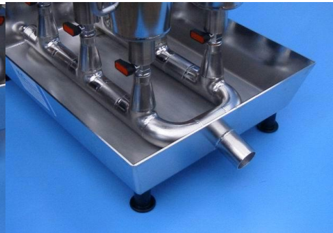
图 3 出水口