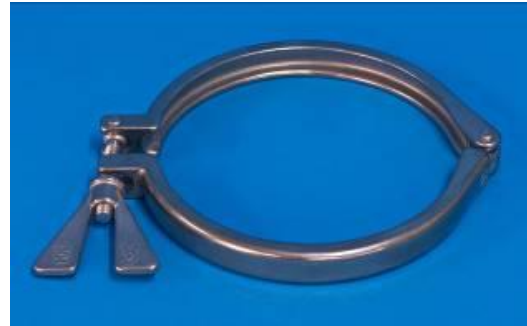
图 7 顶盖夹具