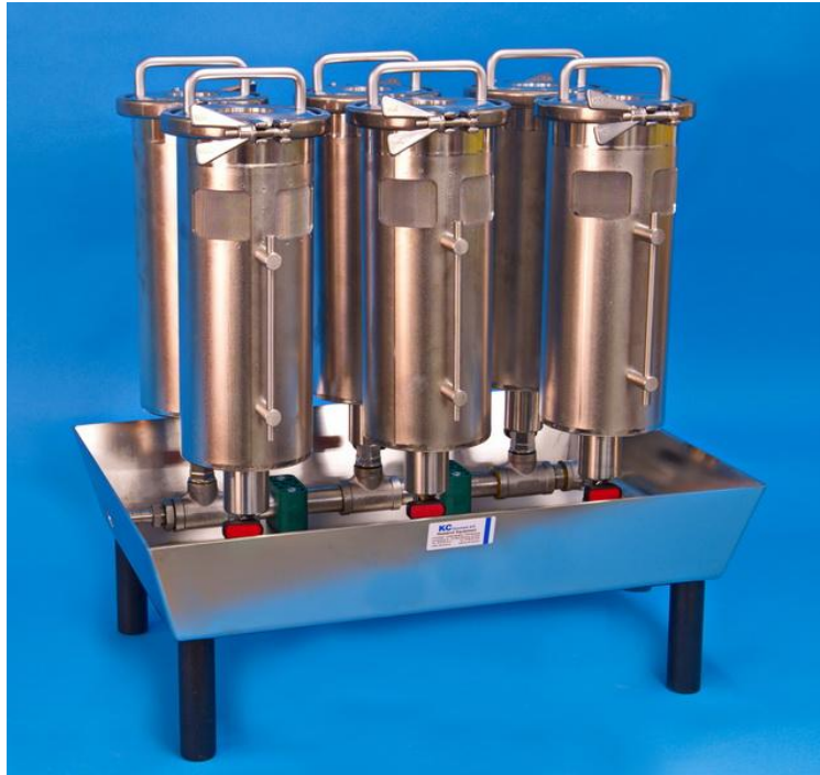
图 1 KC-Denmark 公司甲醛清洗设备