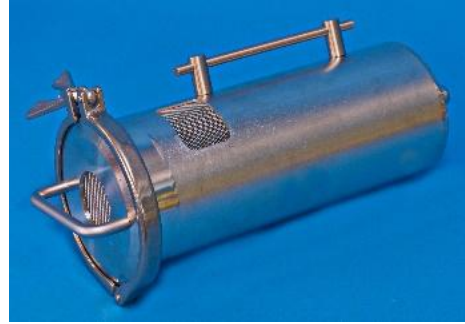
图 5 清洗器