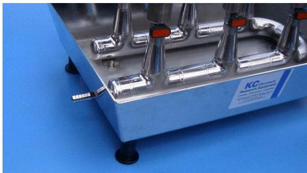
图 2 进水口

每个清洗器侧面有一个矩形小孔，装有 500 \mu m 网目的不锈钢网筛（小至 20 \mu m）。每个清洗器有 1 个手柄，能有效确保使用时的方便和安全。顶部是 1 个焊接上的圆环，直径 180mm，圆环上安装了一个网目 500 \mu m 的不锈钢筛网，底部也有相同目径的网筛，从而防止样品流失。清洗器通过 1 个阀门连接在 2mm 的 AISI 316 不锈钢架上。一个进水接头，一个出水接头。